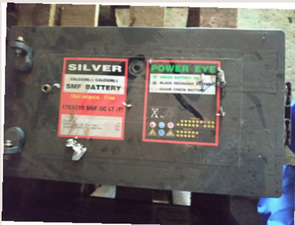
IMAGEN DE LAS BATERÍAS DE LA FUENTE DE ALIMENTACIÓN ELÉCTRICA EN MAL ESTADO

Actualmente, el hospital de Sibonor depende del suministro eléctrico de la ciudad, que es deficiente y tiene repercusiones negativas en la salud de los pacientes.